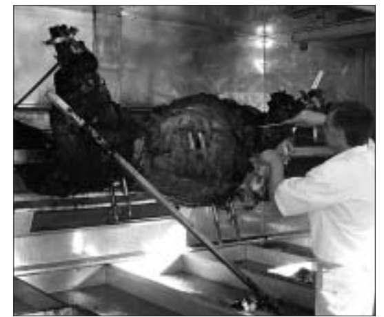
Party-Zutaten: Rock'n Roll, Geschenke, gute Laune, Ochse am Spieß und Party-Girls

W enn die Hamburg Mannheimer International (HMI) einmal im Jahr im Honnefer Seminaris Hotel ihre Bikers Night feiert, muss das Kongresspark-Team alle Register ziehen. Dabei gilt es 500 Versicherer zu unterhalten und zu verköstigen. Um dies zu ermöglichen wurde einmal mehr ein Veranstaltungszelt im Kurpark aufgebaut, sozusagen als Kantine, denn im Kurhaus wurde getagt. Die ultimative Party fand dann am vorletzten Samstag im Foyer und an den Bars des Seminaris Hotels statt. Auch bei der vierten Bikers Night in Bad Honnef sorgten die mittlerweile bewährten Zutaten für Jubel. Traditionell donnern einige HMIler mit ihren Harleys vor die im Foyer aufgebaute Bühne. Gleich danach wird das Buffet eröffnet, mit deftigen Fleischstücken von einem Ochsen am Spieß, der vor dem Hotel seine Runden auf einem riesigen Grill dreht. Zeitgleich