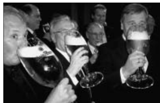
Drei Aalkönige – ein Schluck