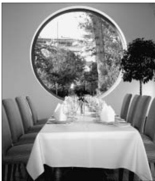
Herrliche Aussichten im St. Anno Park Restaurant, siehe auch Bericht auf Seite 6

pulsiv und gesellig“ bezeichnet, will mit dem Mix aus Café, Lounge und Restaurant allen Zielgruppen Raum „in Champagner- und Dunkelrottönen“ bieten. „Bei uns wird man einfach nur einen Kaffee trinken und Zeitung lesen können, an der Bar Platz nehmen oder mediterrane Spezialitäten genießen.“ Die Speisekarte enthält im derzeitigen Entwurfsstadium 42 Angebote und der Blick auf die dazu gehörigen Preise verblüfft. Luis y Quintana: „Ich rechne noch in DM.“ So liegen fast alle Gerichte recht deutlich unter der 10 Euro-Marke. „Frische, leckere Küche muss