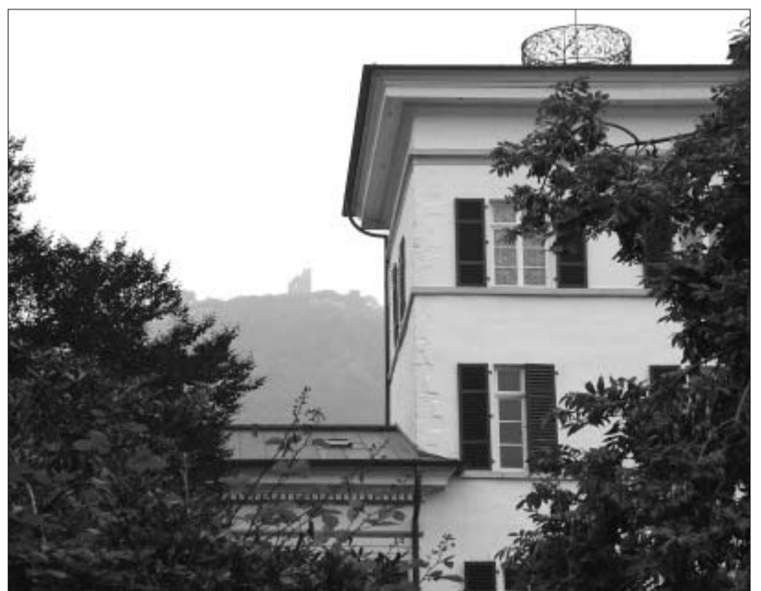
Bürger sorgen sich um die Zukunft der Villa Merkens

Das Erzbistum Köln hat das mitten im historischen Kern von Rhöndorf gelegene Gelände der ehemaligen Landvolkshochschule und der Villa Merkens an einen privaten Investor und an eine Baugesellschaft verkauft. Die bislang bekannt gewordenen Pläne sehen eine massive Bebauung vor, die keinerlei Rücksicht nimmt auf die Bedeutung der Umgebung zwischen den Rhöndorfer Weinbergen und dem Konrad-Adenauer-Haus. Die unter Denkmalschutz stehende Villa Merkens, das älteste Gebäude der Stadt Bad Honnef, hat ein Bonner Weinhändler erworben, der nur ein sehr vages Nutzungskonzept (... „mit gehobener Weinverkostung“...) vorgelegt hat. Viele Fragen bleiben hier offen, so der Erhalt des geschützten Parkes und seine weitere öffentliche Nutzung beispielsweise für das traditionell hier stattfindende Rhöndorfer Pfarrfest. Die nun als Initiative des Bürger- und Ortsvereins Rhöndorf e.V. gegründete Bürgerinitiative „Wir in Rhöndorf“ hat sich zum Ziel gesetzt, den Park der Villa Merkens in seiner Gesamtheit zu erhalten und jede Bebauung zu verhindern. Die Initiative wendet sich gegen die Kommerzialisierung des denkmalgeschützten Gebäudes und setzt sich für eine öffentliche Nutzung ein. Die engagierten Rhöndorfer Bürger wenden sich ebenso gegen die phantasie- und maßlosen Planungen der Baugesellschaft, die die Bebauung des